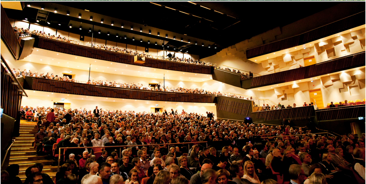
Kongressanläggningen Karlstad CCC där den största lokalen, Solasolen, har kapacitet för 1620 personer.